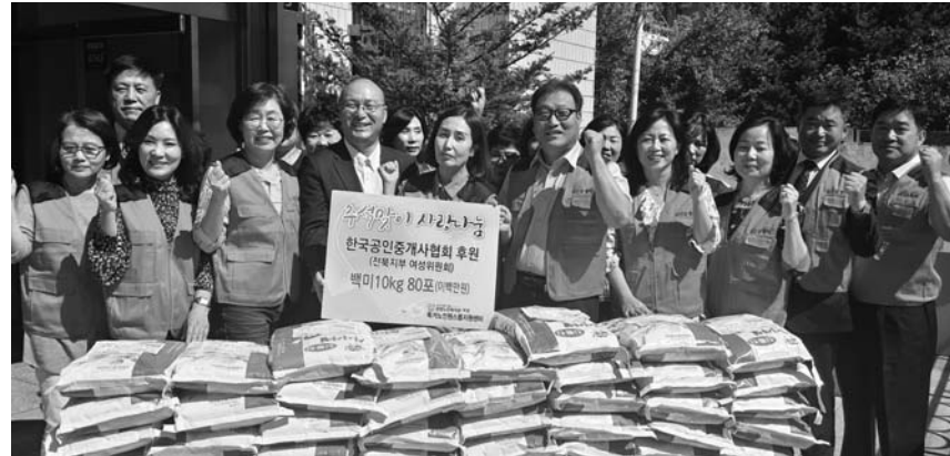
한국공인중개사협회 전북지부는 12일 독거노인 100여명에게 전주시 금암동 원스톱 센터에서 봉사단원 50여 분과 쌀 전달식을 가졌다.