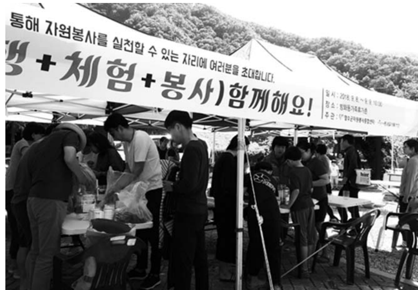
장수군은 10일 '여보, 여행+체험+봉사 함께해요'라는 주제의 불린투어 행사가 지난 8일부터 9일까지 장수군 방화동자연휴양림에서 열렸다고 밝혔다.

장수군 자원봉사종합센터 이미지 센터장은 "이번 불린투어 행사는 바쁜 일상으로 자원봉사를 실천하지 못했던 이들에게 봉사의 기회를 제공하고 동시에 주변 어르신들을 돌아보는 뜻있는 시간이었다"며 "앞으로도 불린투어 행사를 통해 자원봉사활동은 물론 장수군의 관광자원을 널리 알리는데 최선을 다 하겠다"고 밝혔다. /장수=고관호 기자