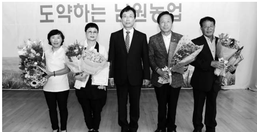
남원시가 천년 보는 농업 만년 웃는 농촌 건설을 역점 추진하고 있는 가운데, 농촌지도자남원시연합회와 생활개선남원시연합회는 3일 문화체육센터에서 회원 900여명이 참석한 가운데 새기술 실천대회를 가졌다.

면별 농·특산물을 전시해 품평 및 재배기술 등을 공유하고 새로운 소득작목에 대한 관심과 도입가능성 등을 타진해보는 뜻 깊은 자리가 되었다.