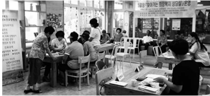
남원시 주민복지과 희망복지지원팀에서는 5일장 찾아가는 희망복지 상담실 운영 복지시각 대를 해소하고 있으며, 5일 장이 열리는 공설시장(4.9일)과 인월시장(3.8일) 원터에서 상담실을 운영하고 있다.

금년에도 7월말까지 29회를 운영해 1,110명(연계 서비스 1억3,400여만원)이 희망복지상담실을 찾아