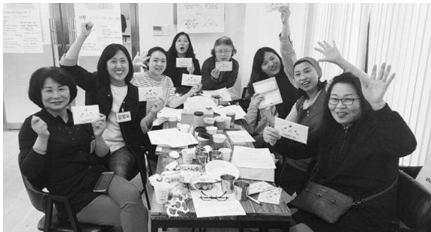
남원시가 지난해에 이어 올해 2회째 '우리마을 공동체 창안대회'를 추진하며 시민들의 호응을 얻고 있다고 밝혔다.

선정 팀은 7월부터 11월까지 팀별로 계획한 공동체 사업을 진행하고 12월 최종 성과 발표를 통해