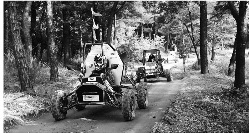
원광대학교 창의공과대학 기계설계공학과 '메카니즘' 팀이 2018 PRIME 국제 대학생 자작 자동차 대회'에서 '차량 외형상'을 수상했다.

이승재 교수는 "2009년에 이어 9년 만에 지난해 대회에 참가했지만, 새로 바뀐 규정과 대회