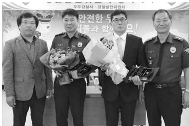
무주경찰서 경찰발전위원회 정기회의 및 자랑스런 무주경찰 시상식