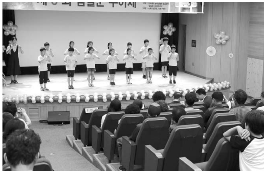
임실군은 지난 5일 임실문화원 공연장에서 실시한 '제3회 임실군 수어제'를 열었다.

임실군은 지난 5일 임실문화원 공연장에서 실시한 '제3회 임실군 수어제'를 성황리에 열었다고 6일 밝혔다. 사)한국농어인협회 전라북도협회 임실군지회 및 임실군 수어통역센터에서 주관한 수어제는 심민 임실군수를 비롯한 청각·언어장애인, 수어교육 및 학부모 등 150여명이 참석했다. 이번 행사는 올해 1월부터 준비한 기획 행사로 임실지역의 지역아동센터, 수어동아리 등 5팀이 3월부터 배워왔던 수어실력을 수어노래를 통해 지역의 청각장애인과 주민들에게 선보였다. 수어제는 우리지역 어린이, 청소년들이 장애에 대한 편견을 버리고 차이와 다름을 인정하고 배려하는 배움의 장을 마련하는 계기가 됐다. 또한 지역주민들에게는 청각장애인에 대한 이해를 높이고, 청각장애인들이 지역사회의 일원으로 다가갈 수 있는 통로 역할을 하고 있다. 조성호 임실군 수어통역센터장은 "각 지역아동센터에 직접 방문하여 수어교육을 실시하고 수어제 발표회까지 직접 연계를 통해 일회성 행사로 그치지 않도록 지속적으로 노력하겠다"고 말했다. 행사에 참여한 심민 임실군수는 "청각장애인과