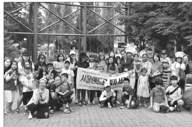
전주시 다문화가족지원센터, 청년회의소 후원 다문화가족 서울랜드 방문