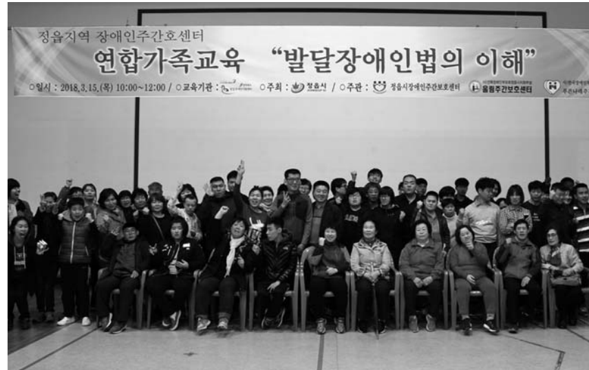
정읍시장애인종합복지관은 전북발달장애인지원센터와 연계해 지난 15일 복지관 대강당에서 발달장애인법 이해를 주제로 한 교육을 가졌다. 교육에는 정읍지역 내 주간보호센터 이용 장애인과 보호자 70명이 참석했다.