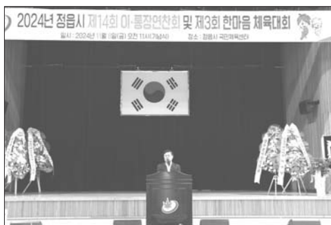
통해 다른 지역 이통장들과 정보를 공유하고 서로의 고충을 이해할 수 있어 매우 유익했다”며 “앞으로도 지역 주민을 위해 최선을 다하겠다”고 소감을 밝혔다.

정읍시는 지난 8일 국민체육센터에서 ‘이통장 연찬회 및 한마음 체육대회’를 성황리에 개최했다.