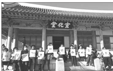
시 보니 감회가 새롭다”며 “겉기 힘들지만 선생님들과 화우들과 함께해서 더욱 기억에 남을 것 같다”고 밝혔다.

진안군 마령은빛문해반 10여 명의 학습자들은 지난 8일 전주부성 음식 투어 주제로 전주에 위치한 문화유산 현장 체험 학습에 나섰다.