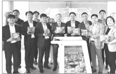
전북대학교 구성원들이 전주시 및 지역사회복지관들과 협력해 고립 청년 지원을 위한 라면 기부 캠페인 '전주함께라면 청년행복할지도'를 진행했다.

전북대학교 구성원들이 전주시 및 지역사회복지관들과 협력해 고립 청년 지원을 위한 라면 기부 캠페인 '전주함께라면 청년행복할지도'를 진행했다. 이 캠페인은 9월 21일 '청년의 날'을 맞아 청년 희망 도시 전주를 만들기 위한 노력의 일환으로 추진됐다. 지난 20일 전북대에 따르면 '전주함께라면'은 전주 지역 6개 사회복지관에서 운영하는 공유공간인 라면카페 사업으로, 사회적 단절과 소통 부족으로 고립된 이웃들이 잠시나마 외부와 소통할 수 있는 기회를 제공한다. '누구나 먹고 가고, 누구나 놓고 가는' 나눔의 선순환 문화를 조성하는 것이 목표다. 전북대 사회복지학과 BK21 지역혁신을 위한 미래복지인력 양성사업단(단장 윤명숙)은 이날 건지광장 문화부에서 대학 교직원과 지역민 등을 대상으로 라면기부를 받는 나눔 캠페인을 펼쳤다. 이날 오전 11시부터 오후 3시까지 컷은 날씨가 가운데서도 대학 구성원들과 시민들은 직접 행사장에 나와 라면이나 후원금을 기부했다. 또한 이날 오후 2시에는 전북대와 전주시, (주)농심이 청년의 사회적 고립 예방 지원 위한 협약식도 가졌다. 특히 양오봉 총장과 우범기 전주시장, 김중식 학생처장, 윤명숙 교수(사회복지학과) 등은 직접 라면 기부에 참여하기도 했다. 이날 라면 기부에 참여한 시민 임 모씨는 "모두가 어