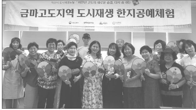
익산시 도시재생지원센터가 금마고도지역 도시재생뉴딜사업으로 참여형 문화예술 프로그램인 '한지공예체험'을 진행하고 있다고 19일 밝혔다.

익산시 도시재생지원센터가 금마고도지역 도시재생뉴딜사업으로 참여형 문화예술 프로그램인 '한지공예체험'을 진행하고 있다고 19일 밝혔다. '한지공예체험' 프로그램은 도시재생 주체인 주민들의 역량 강화와 소통을 통한 공동체 활성화를 위해 마련됐다. 주민 20명은 다음달까지 매주 수요일 한지를 활용해 전통 부채, 전통 소품함, 무드등, 파우치 등 다양한 공예 체험을 진행한다. 작업 만든 작품은 도시재생사업 홍보에 활용되고 오는 10월 준공 예정인 금마공감터와 선화다실 플라마켓에서 전시·판매된다. 도시재생지원센터는 이번 프로그램을 통해 주민들이 공감대를 형성하고, 도시재생에 대한 주민 참여와 이해를 확대할 것으로 기대한다. 시 관계자는 "문화예술교육으로 주민들의 여가 활동을 지원하고 금마고도지역 도시재생사업에 대한 이해와 관심을 높이고자 이번 활동을 마련했다"며 "주민들이 스스로 지역 홍보와 발전 방안을 모색하는 도시재생 사업이 되도록 역량강화와 운영에 최선을 다하겠다"고 말했다. /익산=이재춘 기자