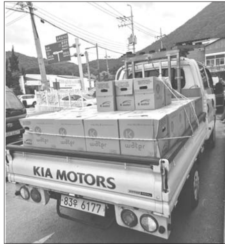
지난 9일부터 10일 발생한 완주지역 집중호우 수해복구 현장에 후원물품과 자원봉사 도움의 손길이 쇄도하고 있다.

수해 현장에 투입된 직원과 자원봉사자들은 주택과 도로, 농경지로 유입된 토사를 제거하고, 유실로 밀려온 흙더미를 마대에 담아 옮겨 담으며 폭우로 침수된