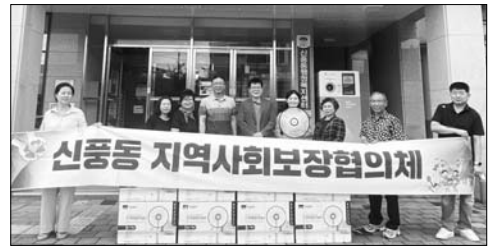
김제 신풍동 지사협, 취약계층 선풍기 지원

주지 아파트의 실제 피난시설을 눈으로 확인하며 경각심을 가질 수 있도록 효과적인 방안을 마련했다. 소재실 남원소방서장은 "앞으로도 안전을 넘어 안심의 남원을 만들기 위해 지역 실정에 꼭 맞는 화재 안전대책을 추진해 가겠다"고 전했다. /남원=김기우 기자