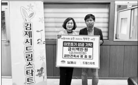
금만건축사, 김제 드림스타트에 기부 이어가