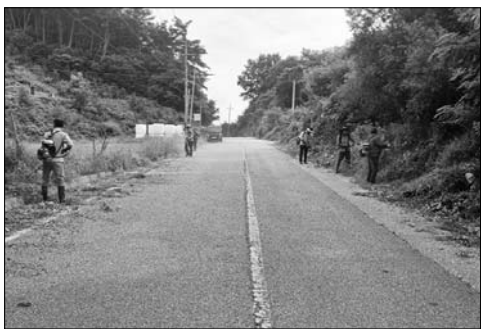
임실 삼계면, 주요 도로변 풀베기

장수군 계남면 지역사회보장협의체는 지난 6월 29일 취약계층 독거어르신 50명에게 반찬(한우 장조림 5종)을 전달하며 나눔을 실천했다. 반찬 나눔 사업은 계남면 지역사회보장협의체 특화사업으로 매월 협의체 위원들이 직접 조리한 반찬을 저소득 가구에 전달하고 인부를 살펴 나눔 실천과 지역사회 돌봄 분위기 조성에 기여하고 있다. 조혜순 민간위원장은 "반찬을 직접 전달하면서 인부를 살펴 나눔의 기쁨을 느낄 수 있었으며 앞으로도 도움이 필요한 이웃들을 위해 지속적인 나눔을 실천하겠다"고 말했다. /장수=고관호 기자