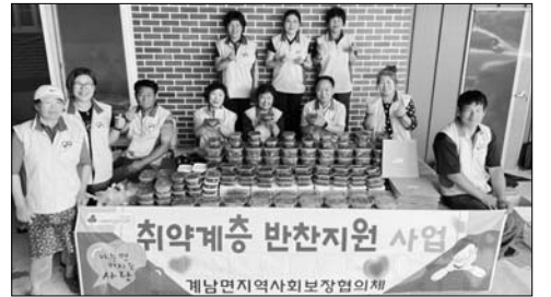
장수군 계남면 지사협, 반찬나눔 봉사 실천