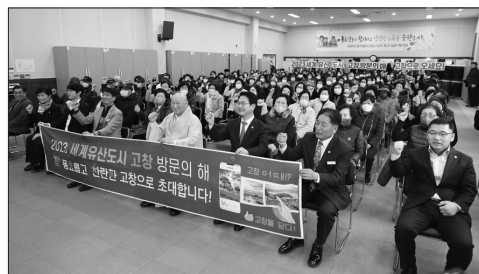
높아지고 있다"며 "더욱 더 많은 어르신들이 노인일자리사업에 사업에 참여할 수 있도록 노력하겠다"고 밝혔다. /고창=김영식 기자

고창군노인복지관의 노인일자리사업이 지난 10일 심덕섭 고창군수, 임정호 고창군의회 의장 등 160여명이 참석한 가운데 안전한 일자리 사업을 위한 발대식을 열었다. 고창군노인복지관 공익형노인일자리 사업은 11월까지 하는 기간제 사업이다. 복지관에선 5개 사업단별 △학교주변 클린환경 도우미(학교주변 정비) △공공 및 복지시설 어르신 행복드림(경로식당 청소 및 소독) △달궁달궁 보육꾸러미 도우미(지역 아동센터 주변 정비) △은빛물결 행복나눔 도우미(경로당 문화활동) △투게더 워드 동행(경륜전수봉사) 등으로 모두 292명의 어르신들이 참여한다. 올해 고창군 전체의 노인일자리사업은 2422명(85억1300만원 예산투입)의 어르신들이 올해 1월부터 11개월간 활동하게 된다. 고창군 관계자는 "어르신들이 사회적 참여 참여 욕구가