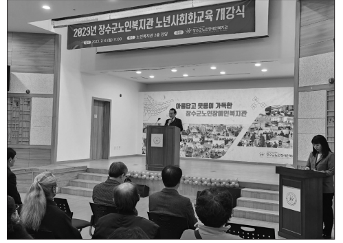
장수노인장애인복지관, 노년사회화교육 개강식

황인홍 군수(무주군교육발전장학재단 이사장)는 "함께 잘 사는 무주를 위해 노력하시는 모습에 깊은 감명을 받았다"며 "미래세대들이 지역과 함께 할 수 있는 우수한 인재로 자랄 수 있도록 장학재단에도 노력하겠다"고 말했다. /무주=전문선 기자