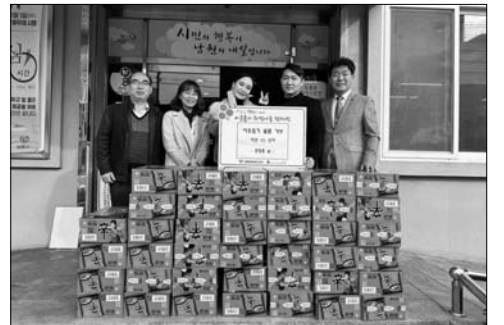
남원시 부부 공무원, 6년째 꾸준한 기탁 '훈훈'

이에 남원소방서는 전통시장에 대한 선제적 소방안전관리를 통해 안전사고 및 대형화재를 예방하고자 실시했으며, △소방시설 설치 및 관리 확인 △가연물 적재관리 확인 △화재 발생 시 초동대응 요령 지도 및 대피로 확인 △관계자 소방안전교육과 안전관리 △애로사항 등을 청취하고 점검 지도했다. /남원=김기두 기자