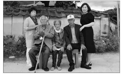
진안군 안천면, 6.25참전 어르신들과 즐거운 동행

진안군 안천면 지역사회보장협의체(지사협)는 9일 90세 이상 마을 어르신과 함께하는 어르신 외출 동행 사업을 추진했다.