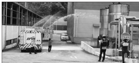
순창소방서, 대상1공장서 합동소방훈련 실시

무주119안전센터(센터장 공근)는 관내 1급 대형공장인 무주군 풀무원다논을 찾아 △관계인 중심의 자율안전점검 및 자율 개선 추진 △생활안전교육 및 생활안전체험 △센터장 현장방문행진 추진 △소방특별조사를 통한 화재안전 컨설팅 등을 실시했다. /무주=전문선 기자