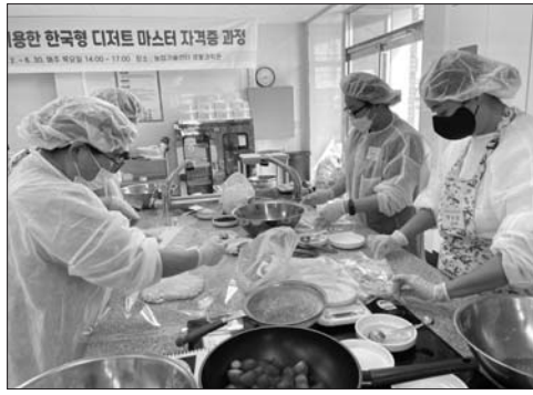
남원농기센터, 한국형 디저트 마스터 자격증 과정 개강

남원시농업기술센터(소장 고인배)는 다양한 우리 쌀 활용을 위한 한국형 디저트 마스터 자격증 과정을 개강했다고 밝혔다.