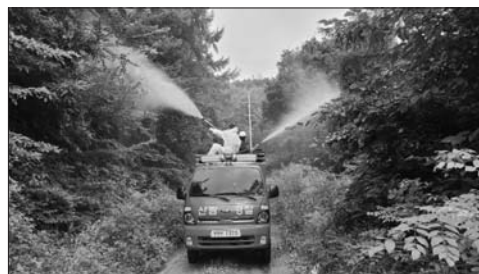
림병해충 예찰과 맞춤형 적기 방제로 산림피해 최소화에 기여하여 산림자원 보호 및 쾌적한 산림을 국민에게 제공하기 위하여 최선을 다할 것이다"며 "이는 지역주민의 적극적인 동참 없이는 이루어질 수 없으니 반드시 참여를 당부한다"고 재차 당부했다. /무주=전문선 기자

무주국유림관리소 관계자는 "매년 발생하는 산림병해충에 대하여 철저한 데이터 관리를 통해 효율적이고 신속한 산