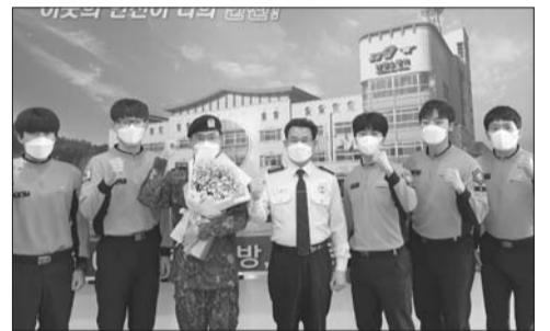
남원소방서, 의무소방원 전역식 가져

남원소방서(서장 박덕규)는 25일 서장실에서 병역의무를 성실히 마친 64기 의무소방원에 대한 전역식을 가졌다.