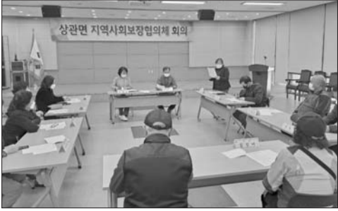
상관면 지역사회보장협의체, 정기회의 및 취약계층 반찬 전달