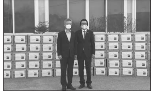
남원시 재경송동면항우회장, 라면 300박스 기부