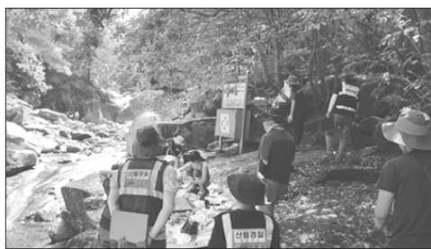
무주국유림관리소 관계자는 "여름 휴가철 산림피해 최소화를 위해 불법행위 단속 및 홍보활동을 지속적으로 실시하고, 숲이 코로나19로 지친 많은 이의 심신을 회복하는 도움이 되도록 노력하겠다"고 말했다.