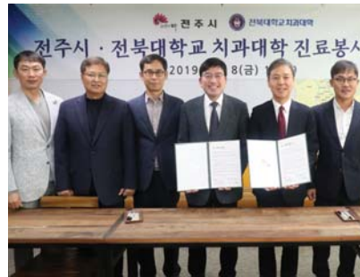
전주시와 전북대학교 치과대학이 저소득 취약계층의 구강건강을 함께 돌보기로 했다.

한편 전북대학교 치과대학은 지난 1979년 설립돼 현재까지 1420여명의 졸업생을 배출했으며, △다문화가정 및 외국인 노동자 치과진료 △보육원정기진료 △무의촌 여를 의료봉사 활동 등 쉽게 치과진료를 받지 못하는 취약계층을 찾아