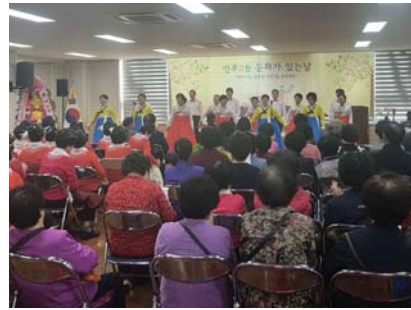
전주시 덕진구 인후2동 마을계획추진단이 지난달 31일 동 주민센터에서 달콤한 음악회를 개최했다.