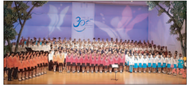
남원시립 소년소녀합창단, 전국시립소년소녀 합창제 참가

기로 축산사업이 더욱 성장 발전할 수 있도록 축산조합원 모두의 적극적인 참여와 협조를 당부드린다"고 말했다. 박우정 군수는 "고창부안축협은 축산업 진흥과 축산농가의 경제·사회적 지위향상과 지역경제발전을 위해 큰 힘이 되고 있다"며 "행정에서도 한우명품화와 조사료생산기반 확충, 축사시설현대화, 구제역 및 AI 방역대책 추진 등 축산산업의 경쟁력을 높이고 친환경축산업육성에 적극적인 지원을 해나가겠다"고 말했다. /고창=김영식 기자