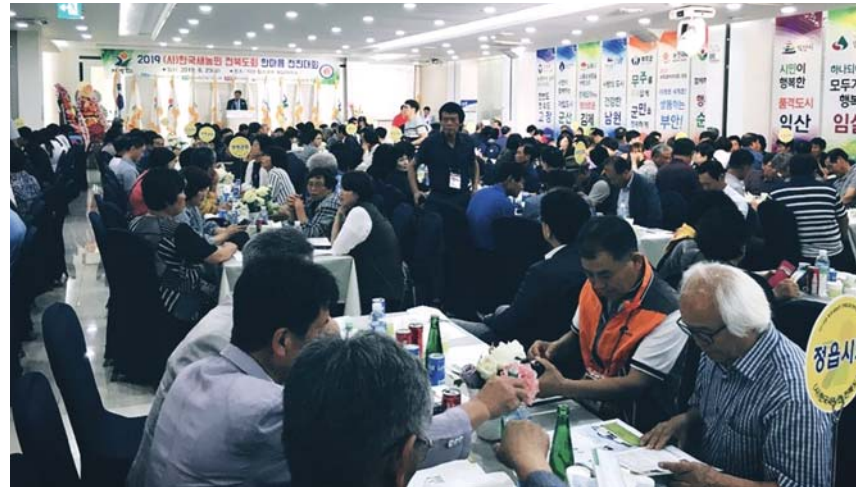
전북농협과 전북 새농민회는 지난 23일 익산시 힐스코트에서 '2019년 한국새농민 전북대회 한마음 전진대회'를 개최했다.

한편 한국새농민회는 농협에서 자립·과학·협동 정신을 실천하는 최우수 농업인을 선발하여 새농민상을 수상한 선도 농업인으로 조직된 단체