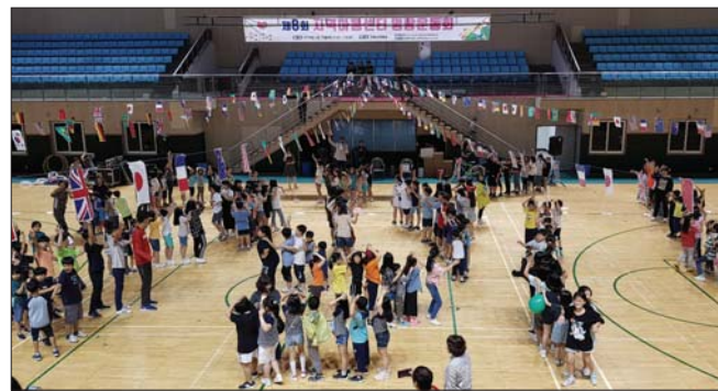
남원시와 지역아동센터, 명랑체육대회 개최 해

대상을 수상했다. 또한, 전현결(전남 왕운초 2)군과 장지수(전주 만수초 4), 변호진(익산 함열초 5)군이 학생부 대상을 수상했고, 이채원(새싹어린이집) 어린이가 유치부 대상의 영광을 안게 됐다. 이어, 함께 열린 대회공로자 표창장 수여식에서 김기수씨가 전북도지사 표창을, 고석철씨가 전주시장 표창을, 고석준씨가 전주시의회회장 표창을, 김제철씨가 전북도민일보 표창장을 수여받았다. /김재훈 기자