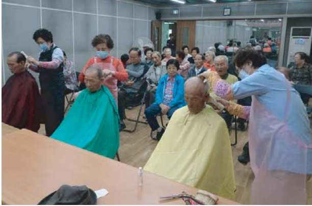
전주시 효자3동에서는 22일 저소득층과 홀로 사는 어르신 40여 명을 초청해 성심사랑 봉사단 주관으로 이·미용 봉사활동을 펼치고 있다.