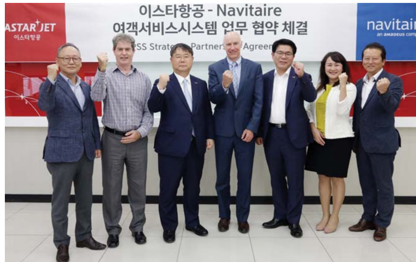
이스타항공이 나비테어(Navitaire)와 여객서비스 시스템(PSS·Passenger Service System)의 10년 연장계약 체결했다.

적인 파트너십을 통해 고객들에게 안정적인 예약 발권 시스템을 제공해오고 있다.”며, “업무협약 체결을 통해 항공시장의 변화에 발맞춰 다양한 항공서비스를 제공해 나갈 것”이라고 말했다.