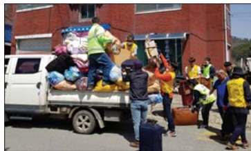
안성면에 거주하는 독거노인이며, 치매로 인하여 의류 및 폐물품 등을 수집하여 건강에 위협한 환경에 지내오고 있었다. 이에 안전하고 위생적인 주거환경을 만들어 주고자 3개 기관이 연합하여 깨끗하고 안정적인 주거 환경을 조성했다.