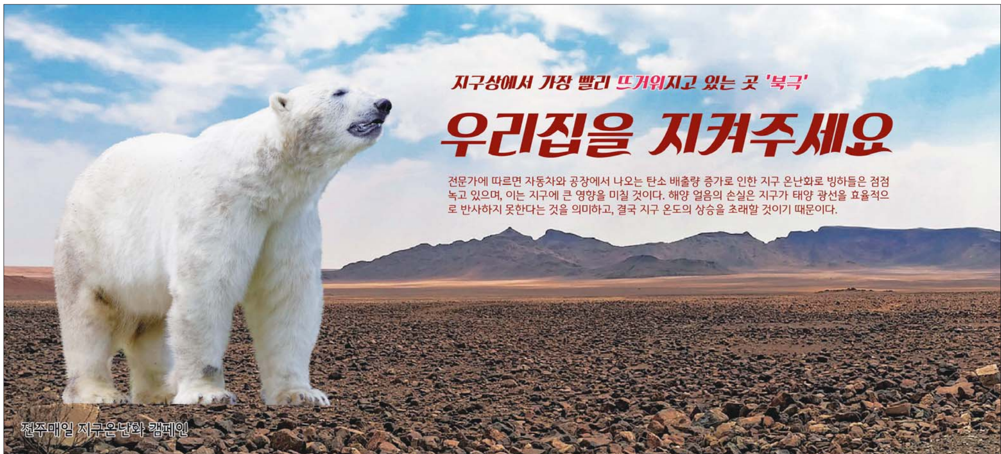
전주매일 지구온난화 캠페인