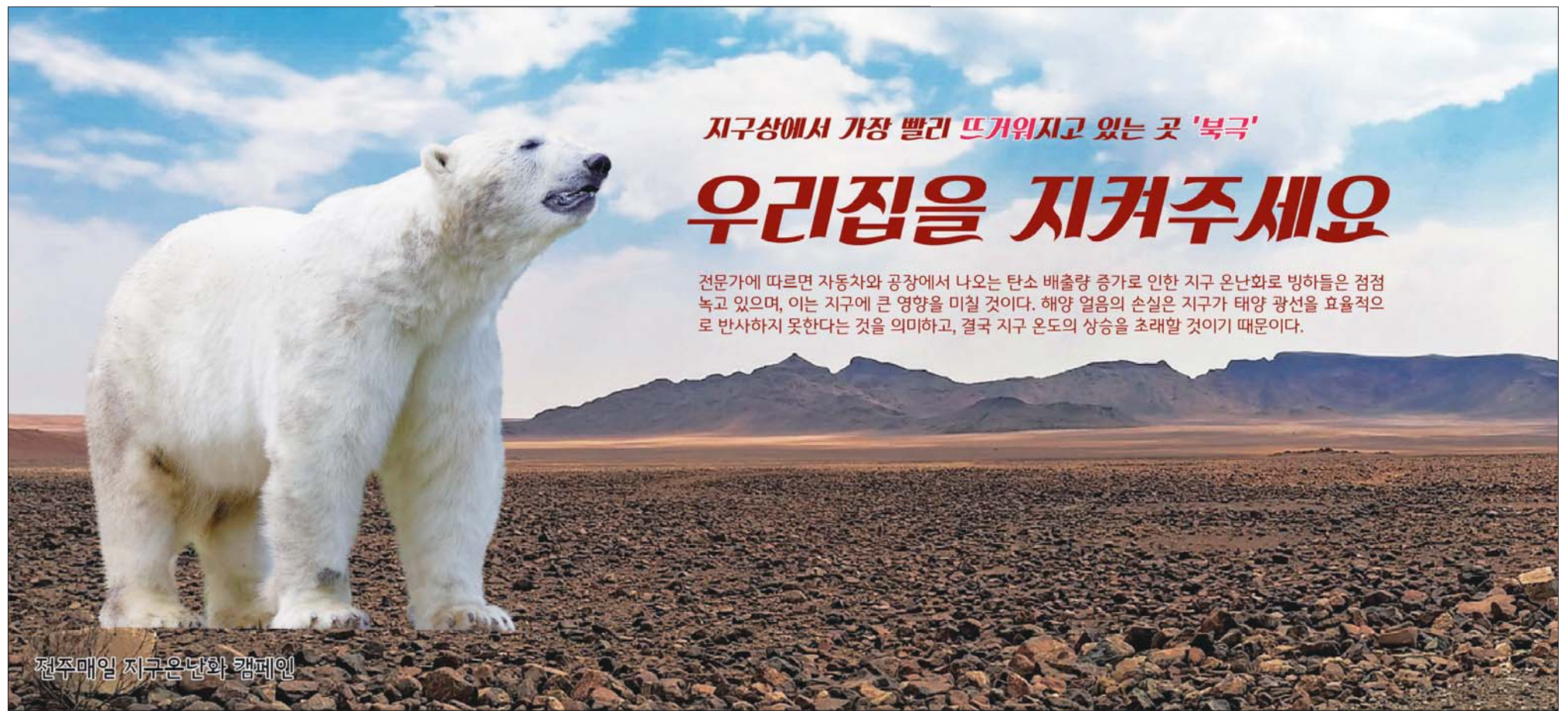
전주매일 지구온난화 캠페인