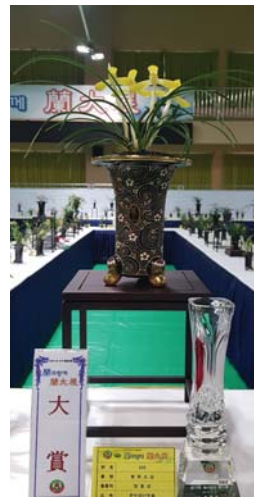
대상을 차지한 황화소심 정수연씨.