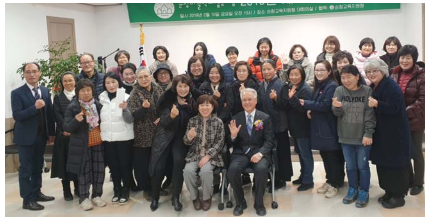
순창마을학교협동조합은 최근 순창교육지원청 대강당에서 제1차 정기총회를 개최했다.