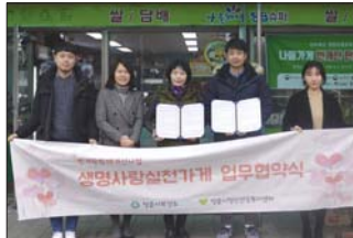
정읍시(시장 유진섭)는 6일 착화탄(번개탄)을 판매하는 관내 업소 5개소를 '생명사랑 실천가게'로 선정하고 현관 전담 및 업무 협약을 맺었다고 밝혔다. 이번 사업을 위해 정읍시는 착화탄 관련 사망률이 높은 지역을 선정하여 판매 형태를 사전조사를 실시했다. 조사를 바탕으로 번개탄 판매 형태 개선과 관련된 매뉴얼을 제작·배포하고 판매방법에 대한 교육을 실시했다. 또한 추후에 이들 업소를 대상으로 게이트키퍼(생명지킴이) 양성 교육을 실시하여 지역사회 생명존중문화 확산에 크게 기여토록 할 예정이다. /정은=김대환 기자

정읍시(시장 유진섭)는 6일 착화탄(번개탄)을 판매하는 관내 업소 5개소를 '생명사랑 실천가게'로 선정하고 현관 전담 및 업무 협약을 맺었다고 밝혔다. 이번 사업을 위해 정읍시는 착화탄 관련 사망률이 높은 지역을 선정하여 판매 형태를 사전조사를 실시했다. 조사를 바탕으로 번개탄 판매 형태 개선과 관련된 매뉴얼을 제작·배포하고 판매방법에 대한 교육을 실시했다. 또한 추후에 이들 업소를 대상으로 게이트키퍼(생명지킴이) 양성 교육을 실시하여 지역사회 생명존중문화 확산에 크게 기여토록 할 예정이다.