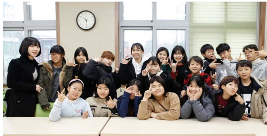
전주 새연초등학교 연극부(노을이 지도교사)가 지난 2일 제26회 전국어린이연극경연대회에서 금상(문화체육관광부장관상)을 수상했다.

새연초는 6학년 수업혁신학년 지원을 받아 연극부를 비롯해 역사, 기타, 요리, 보컬 등 9개 동아