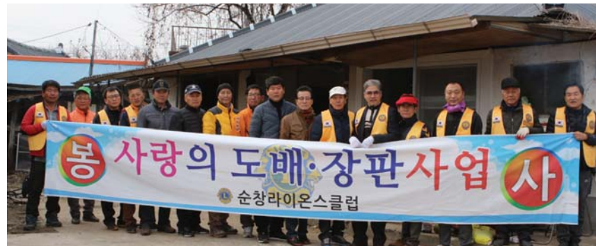
순창라이온스클럽은 관내 거주 독거노인을 비롯한 소외계층 등 6가정을 선정해 도배 및 장판교체와 주거환경정비 등 봉사활동을 펼쳤다.

봉사활동에 참여한 회원들은 "작은 마음 하나하나가 모여 지역의 어려운 내 이웃에게 부족하지 않다면 따뜻함을 전해줄 수 있었다는 것만으로도 보