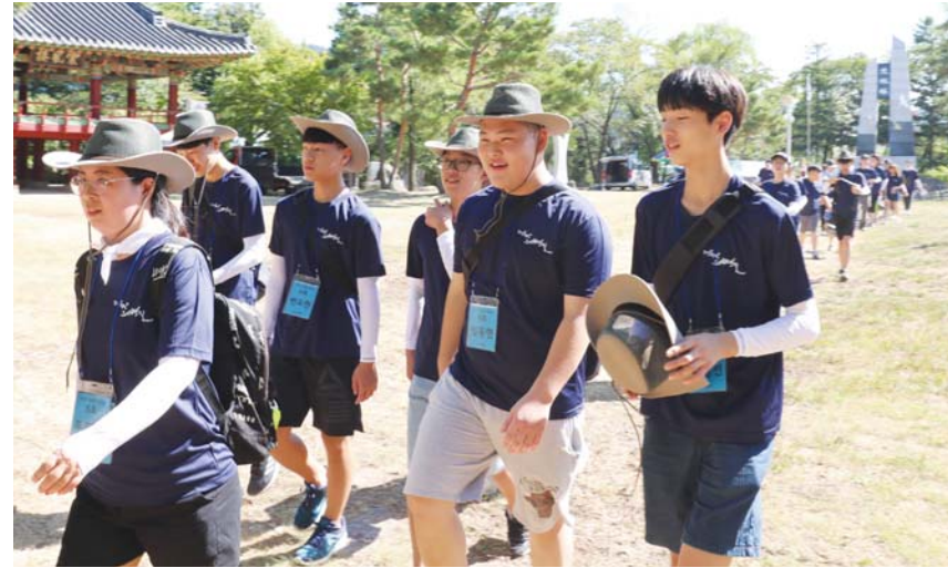
제7회 덕유산 의병길 체험행사가 15일 열렸다.

참가 학생들은 “날은 덥고 힘들기도했지만 보람 있었다”며 “애국애민의 마음을 되새기며 올 여름방학을 의미 있게 마무리하게 돼 기쁘다”고 전했다.