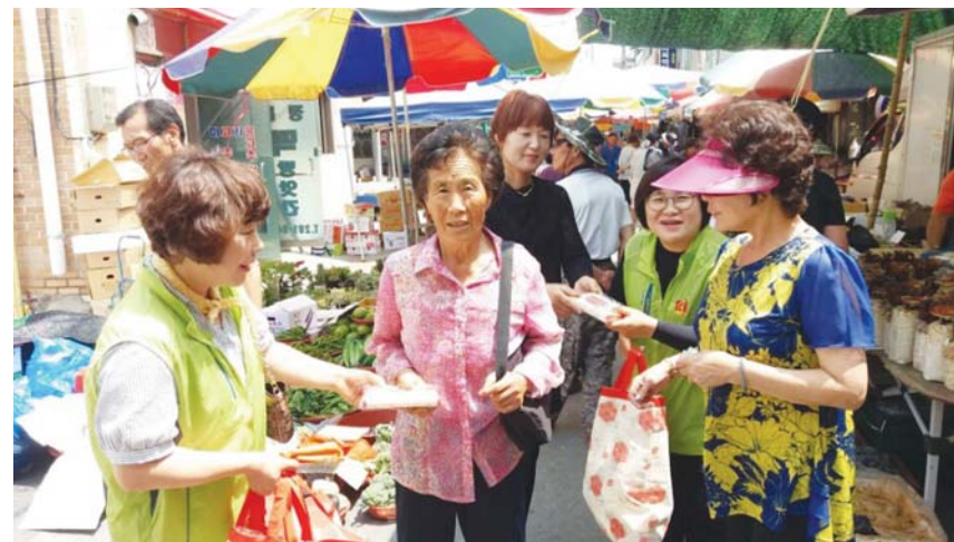
완주군 지역사회보장협의체 지역민들기 분과에서는 18일 삼례시장 개장식에서 환경을 해치는 비닐봉지대신 종이 장바구니를 준비해 시장을 보는 분들에게 나누어드리는 활동을 진행했다.

이날 시장을 보던 한 어르신은 "비닐봉지도 좋지 만 미래의 환경과 완주군을 위해 시장바구니를 주니 아주 좋았다며 집에서도 일회용품 사용을 줄여야겠다"고 말했다.