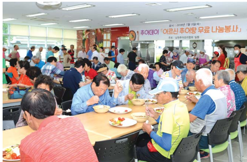
남원시 추어요리협회는 지난 5일 추어 day를 맞아 남원시노인복지관에서 지역 어르신 250명에게 추어탕 무료 나눔 봉사를 실시했다.

또한 이환주 남원시장은 “추어요리는 영양도 풍부하고 소화가 잘되기 때문에 여름철 최고의 보양식으로 각광받고 있다며, 올 여름에도 추어요리로 건강도 챙기고 더위를 이겨내었으면 한다”고 말했다. /남원=김기두 기자