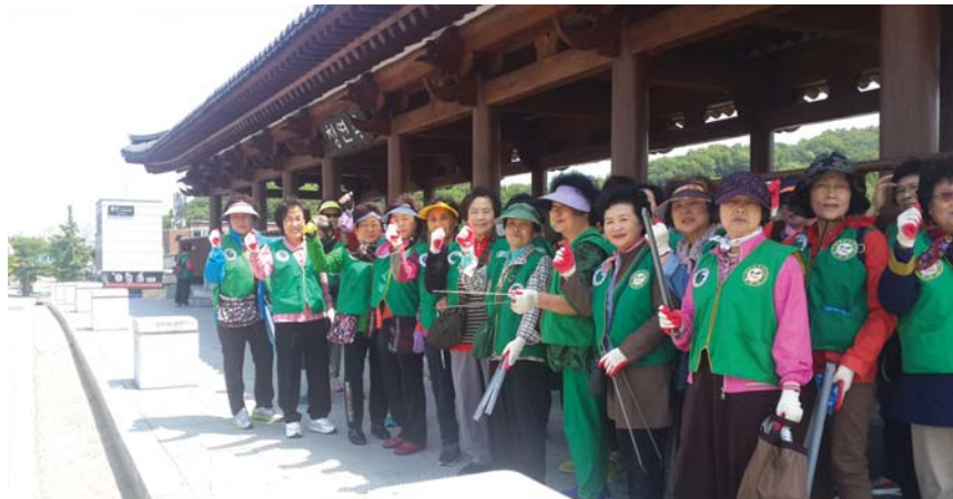
전주시 주부환경감시단이 제19회 전주국제영화제를 찾는 관람객들에게 쾌적한 도시 이미지를 심어주기 위해 도심 곳곳을 깨끗이 정비했다.

개최하고, 제19회 전주국제영화제의 성공적인 개최를 지원하기 위해 많은 관람객들이 찾는 한옥마을과 전주천을 찾아 분리배출 홍보 및 환경정화활동을 펼쳤다. 이날 주부환경감시단원들은 때 이른 여름 날씨에