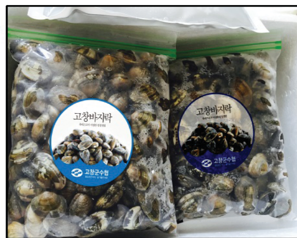
해감바지락 & 관 바지락