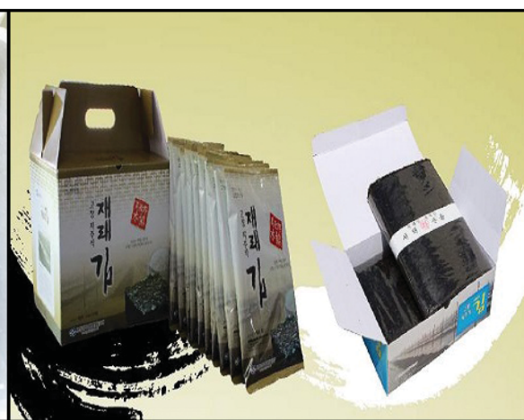
가공김 & 재래김