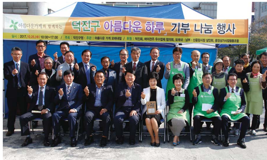
덕진구청에서는 25일, 아름다운가게 모래내점과 함께 복지소외계층의 월동비 마련을 위한 '2017덕진구 아름다운 하루' 나눔행사를 추진했다.

덕진구청 직원들이 판매 자원봉사자로 참여했고 인근 아파트와 지역 주민들의 대거 방문으로 성황리에 판매가 이루어졌으며 특별상품 전시 및 짝꿍경매 이벤트 추진 등으로 행사의 재미를 더했다.