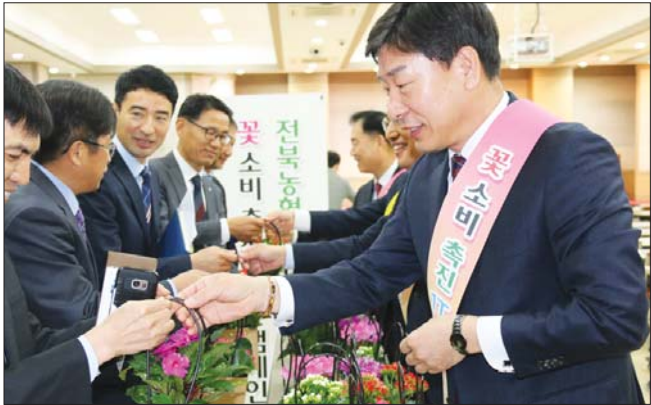
전북농협, 꽃 생활화 캠페인 전개

전북농협은 청탁금지법 시행 이후 어려움을 겪고 있는 화훼 농가를 지원하기 위해 6월 지역본부에서 직원들에게 책상용 꽃 화분 150개를 나눠 주는 캠페인을 실시했다.