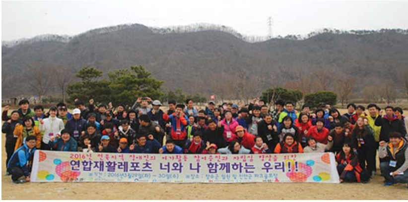
약으로 인해 접해보지 못한 다양한 레포츠체험 활동을 제공하고, 타지역의 장애인들과의 교류를 통해 정보공유 및 친교적 능력을 향상시키고자 한다. /장수=고관호 기자

장애인 연합 재활레포츠 프로그램은 전북사회복지공동모금회 지원으로 올해 총 4회기가 진행되며, 전북지역에 장애인들이 지리적, 신체적 제