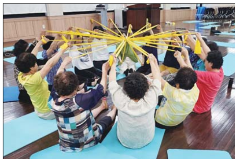
올적인 동아리 모임을 다양하게 형성하여 함께 건강 활동에 힘쓰기를 바라며 건강생활지원센터에서도 아낌없이 지원하겠다"고 전했다.

군산시 보건소 서부건강생활지원센터는 2023년 서부지역 주민들을 대상으로 다양한 내용의 건강동아리 활동을 구성 및 지원하여 약 530명이 참여하는 등 대상자들로부터 큰 호응을 얻었다. 20~50대 여성이 모인 '산소마인' 건강동아리는 전문강사 지도하에 비누공예 및 천연제품 만들기, 건강체조 동영상 통한 유산소 운동, 운동관리실 기구 사용한 순환 운동 등 실생활에 유용하게 쓸 수 있는 비누 및 생활용품 등을 직접 만들고 동아리원들끼리 자율 운동을 하며 성취감을 높였다. 60세 이상 대상자가 모인 '청춘교실' 건강동아리는 실버 체조 강사를 통한 실버 레크레이션 및 체조, 지역주민 건강지도자 지도하에 라인댄스 배우기 등의 활동을 벌였다. 또한 간담회 시간을 통해 회원들끼리 친목을 다지며 건강 정보 및 동아리 추후 활동 계획을 공유했다. 군산시 보건소 관계자는 "앞으로도 서부지역 주민들이 자