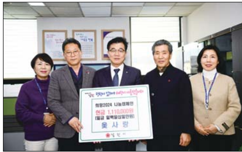
나눔 활동에 동참하고자 하는 개인이나 단체는 시청 주민복지과(063-620-6333)나 가까운 읍면동 행정복지센터에 연락하면 자세한 안내받을 수 있다.