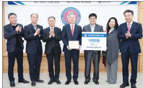
우리 전북대학교에 혁신 동력이 되길 바랍니다"고 덧붙였다. /장은성 기자

"갑진년(甲辰年), 여의주를 입에 물고 승천하는 청룡처럼 우리 전북대학교도 용비(龍飛)하는 한 해가 되길 바랍니다." 전북대학교 양오봉 총장이 2024년 새해 첫 날 1천만 원의 발전기금을 기부했다. 지난해 학생 맞춤형 복지 증진을 위한 1천만 원 기부에 이은 두 번째다. 전북대 발전지원재단에 따르면 2일 오전 10시 대학본부 총장실에서 대학 주요 관계자 등이 참석한 가운데 발전기금 기증식을 갖고 양오봉 총장에게 감사패를 전달했다. 양 총장은 "학생이 있어야 전북대학교가 존재할 수 있다"며 "학생, 학생에 의한, 학생을 위한 전북대학교"를 만들기 위해 총장이 앞장선다는 의미로 새해 첫 날 의미 있는 기부를 했다"고 말했다. 이어 "글로벌대학30 사업을 위한 담대한 여정에 나서는