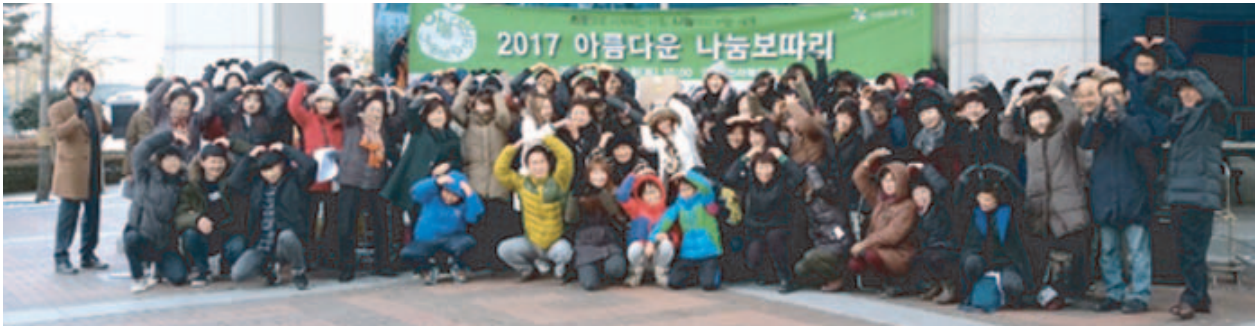
아름다운가게가 설을 맞아 홀몸 노인들에게 생필품을 전달하는 '아름다운 나눔보따리' 행사를 가졌다.