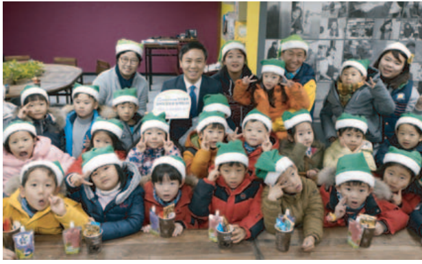
했다. 코끼리유치원은 올해 원아들과 함께 연간 1,000장을 소외된 이웃들

이를 통해 자신에게는 필요 없는 물건이 남들에게는 소중한게 쓰일 수 있다는 점을 배우고, 성금 기탁을 통해서 나눔 실천을 몸소 체험