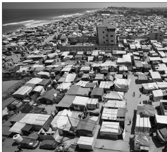
이스라엘군의 공습과 지상 공격으로 피란길에 나선 팔레스타인 난민들이 12일(현지 시각) 가자지구 데이르 알발라에 임시 천막촌을 형성하고 있다.