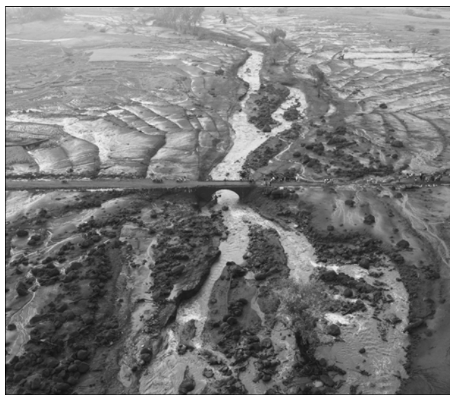
13일(현지 시각) 인도네시아 서수마트라주 띠나디타르 마을 주민들이 전날 폭우로 인해 발생한 홍수 피해 상황을 살펴보고 있다. 현지 당국은 전날 폭우로 돌발 홍수와 산사태가 발생해 최소 37명이 숨졌다고 밝혔다.