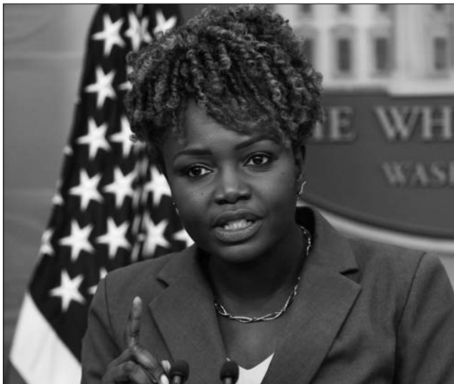
카린 장-피에르 백악관 대변인이 8일(현지시간) 백악관에서 일일 브리핑을 하고 있다. 장-피에르 대변인은 "여제 올해 들어 201번째 총기사건이 발생했다"라면서 "만 4000명 이상이 목숨을 잃었다는 통계가 있지만 공화당 의원들은 '할 수 있는 일이 없다고 한다'"라고 비난했다.