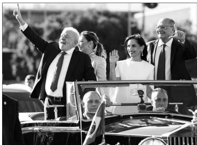
루이스 이나시우 룰라 다시우바(왼쪽) 브라질 대통령이 1일(현지시간) 부인 호진젤라 시우바, 제라우두 아우키밍(오른쪽) 부통령 부부의 함께 플라날토공으로 이동하면서 지지자들에게 인사하고 있다. 룰라 대통령은 이날 의회에서 취임 선서를 하고 공식 4년 임기를 시작했다.