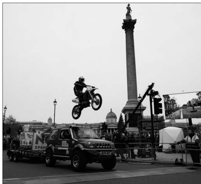
1일(현지시간) 영국 런던의 트래팔가 광장에서 새해 퍼레이드가 열려 오토바이 곡예팀이 모기를 선보이고 있다.