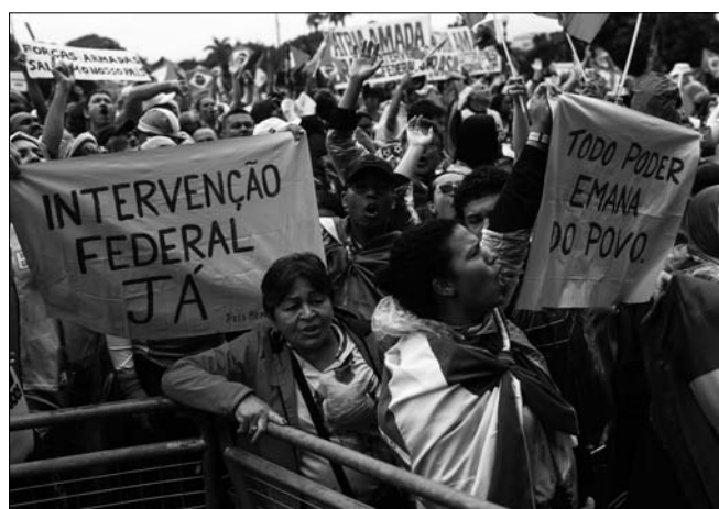
자이르 보우소나루 브라질 대통령의 지지자들이 2일(현지시간) 리우데자네이루에서 열린 대통령 결선투표 패배 불복 시위에 참석해 "즉각 군사 개입" 권력은 국민으로부터"라고 쓰인 현수막을 들고 있다. 앞서 보우소나루 대통령이 루이스 이나시오 룰라 다시우바 대통령 당선인에게 정권을 이양하겠다는 의지를 보였음에도 그의 지지자들은 군대가 개입해 보우소나루 대통령을 유임시켜야 한다며 시위를 벌였다.