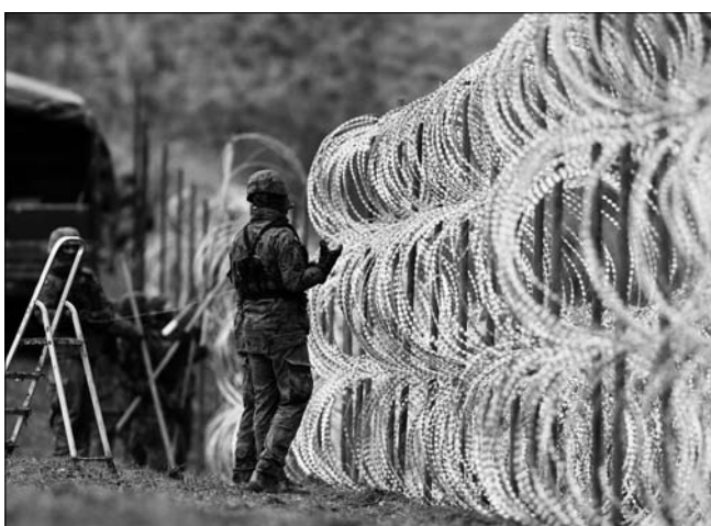
2일(현지시간) 폴란드 군인들이 비슈티나에츠에서 러시아 역외 영토 칼리닌그라드의 국경 지대에 철조망 장벽을 설치하고 있다. 폴란드 정부는 러시아가 최근 중동과 북아프리카로부터 칼리닌그라드행 항공편을 취항하기로 하자 이 지역을 봉쇄하고 보안을 강화하고 있다.