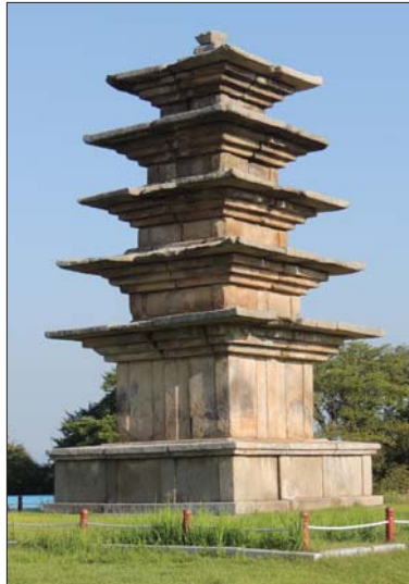
가 있으며, 나머지 행방은 어떠한지 진상을 파악해야 한다. '사리 없는 사리장엄구나 석탑'은 한낱 빈 껍데기일 뿐이다"고 강력 비판했다. /익산=정영원 기자

이금용 씨는 “왕궁리오층석탑 사리는 현존 사리 중 국내최초로 들어온 진신사리로 평가되는데 무슨 권한과 절차를 거쳐 영주 부석사에