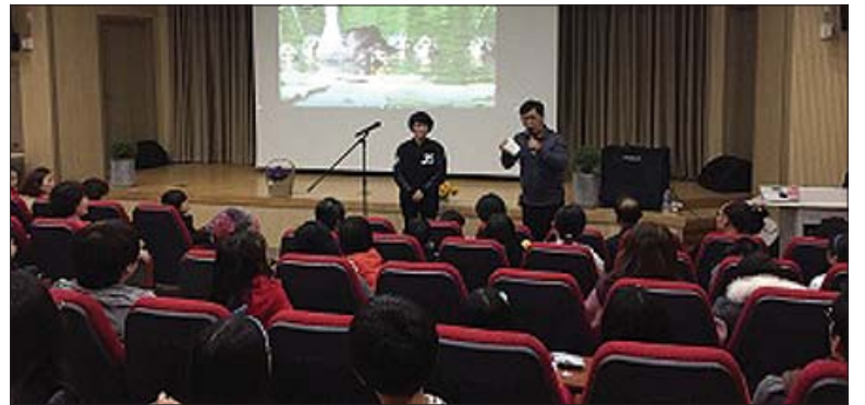
정읍시립중앙도서관이 제55회 도서관 주간을 맞아 다양한 프로그램을 마련한다.