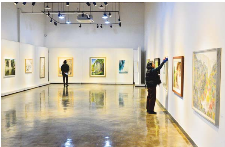
순창의 아름다운 절경을 화폭에 담은 제3회 섬진강 전국사생공모전 입상작 20여점을 옥천미술관에 전시해 군민들에게 선보인다.

순창군이 순창의 아름다운 절경을 화폭에 담은 제3회 섬진강 전국사생공모전 입상작 20여점을 옥천미술관에 전시해 군민들에게 선보인다.